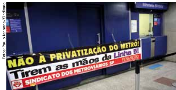
Bilheteria terceirizada em Capão Redondo

Fizemos audiências públicas, com a participação de parlamentares e movimentos sociais, e vários atos contra essas medidas. Não deixaremos que entreguem o patrimônio do povo: vamos resistir e lutar contra a perda de direitos e em defesa do transporte. Participe você também. Some-se a esta luta e garanta um metrô público, estatal de qualidade!