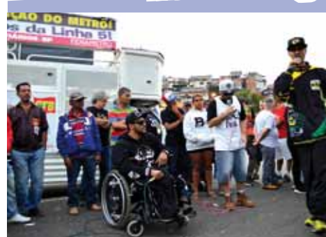
Ato-show contra a privatização da Linha 5

O Sindicato é contra a terceirização e a privatização e está em luta contra estes ataques. Na madrugada de 24/6 realizou ato-vigília, contra a entrega das bilheterias, e no mesmo dia aconteceu um ato político-cultural na Estação Capão Redondo,