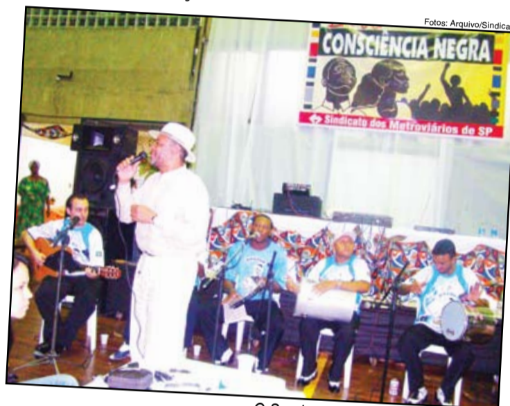
O Samba do Cafofo animou o evento

A categoria metroviária, seus amigos e familiares realizaram uma bela festa na quadra do Sindicato, na noite do dia 28 de novembro, com o objetivo de celebrar o Dia da Consciência Negra, alertar sobre a situação dos negros no nosso país e reivindicar a igualdade de oportunidades para todos e o fim da discriminação racial