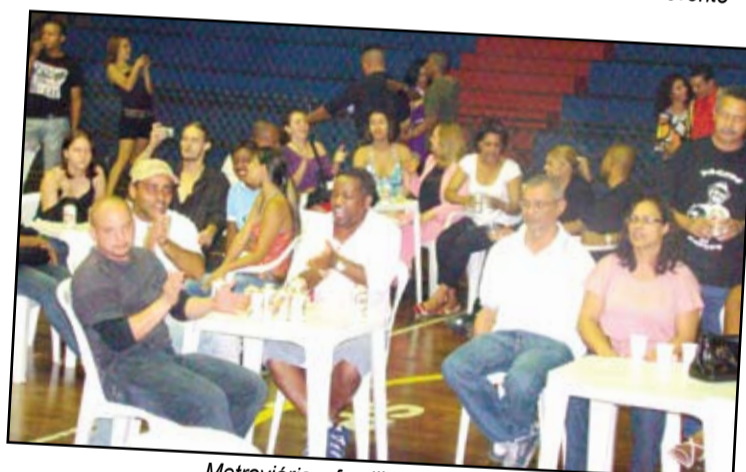
Metroviários, familiares e amigos prestigiaram o evento