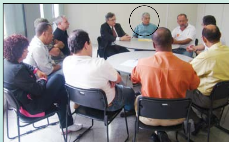
No destaque, o secretário dos Transportes em reunião com os representantes do Sindicato