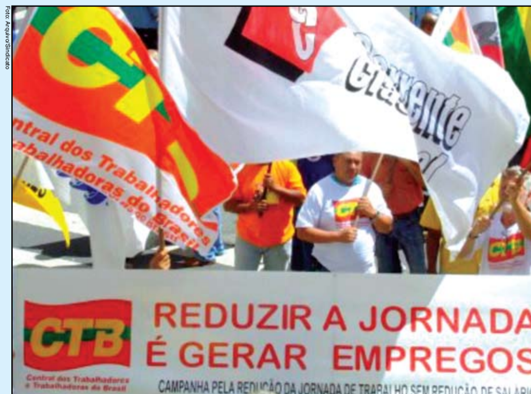
Ato de lançamento da Campanha Unificada pela Redução da Jornada de Trabalho sem Redução de Salários organizado pelas centrais sindicais