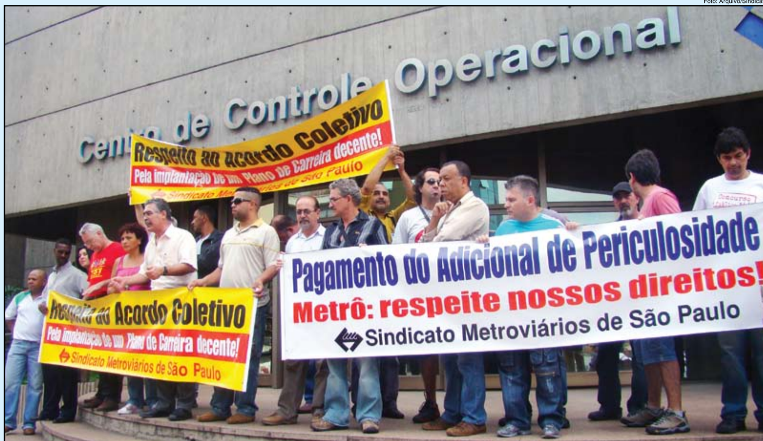
Ato realizado em frente ao CCO, dia 18/11, em protesto contra o descumprimento do Acordo Coletivo da categoria

Depois da realização do ato em frente ao CCO, a categoria obteve respostas sobre algumas de suas reivindicações, mas isso não muda em nada a atual situação dos metroviários, que continuam sendo prejudicados com diversas formas de descumprimento do acordo coletivo e de precarização das relações de trabalho, como as discrepâncias salariais entre funcionários com funções iguais; implantação de escalas de trabalho conforme conveniência; entre outras