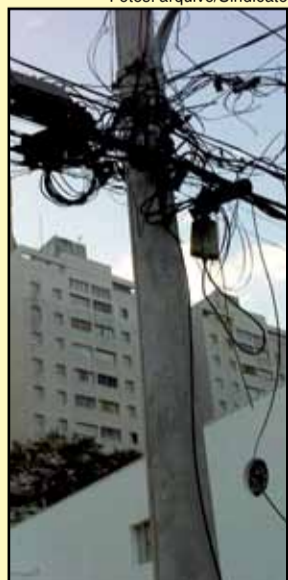
Eletropaulo: piora nos serviços após privatização

Diante dos incontáveis apagões sofridos recentemente na cidade de São Paulo, Alckmin declarou: a Eletropaulo não tem “condições mínimas de operar com segurança em dias de chuva”.