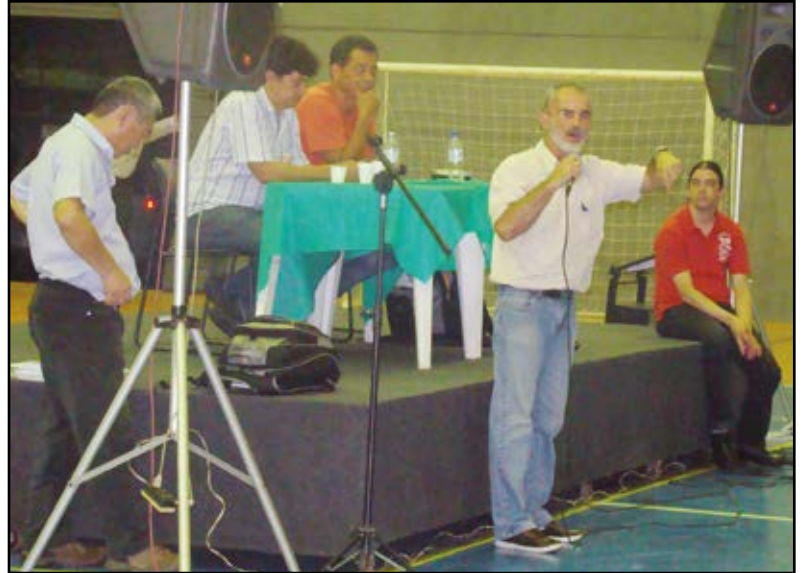
Assembleia do dia 7/12 considerou positiva a semana de mobilização