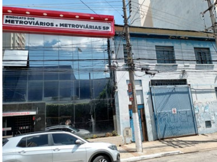
Nova área do Sindicato é ao lado do prédio da sede atual